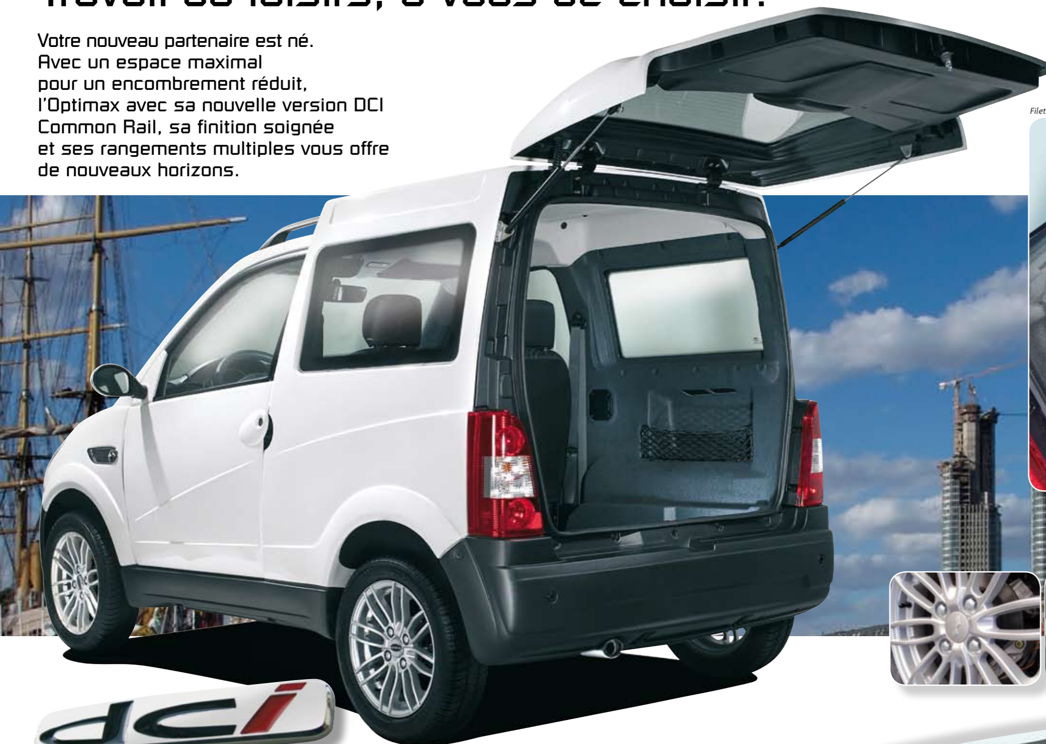
Filets de coffre livrés en accessoire

Votre nouveau partenaire est né. Avec un espace maximal pour un encombrement réduit, l'Optimax avec sa nouvelle version DCI Common Rail, sa finition soignée et ses rangements multiples vous offre de nouveaux horizons.